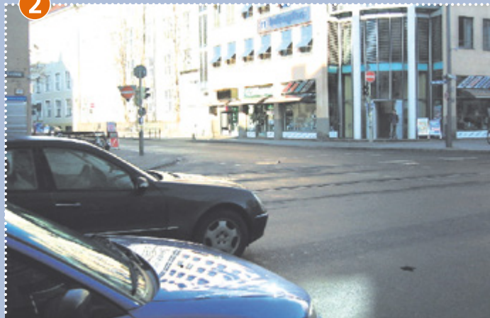
Kreuzung Tegernseer Landstraße/Silberhornstraße