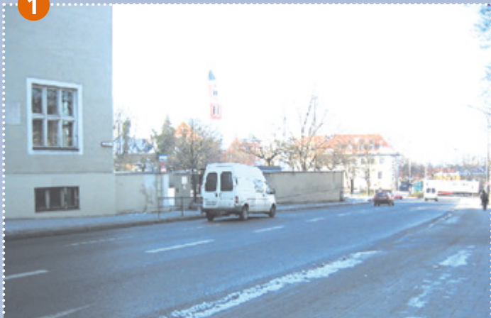
Grundschule an der Ichostraße (Eingang)