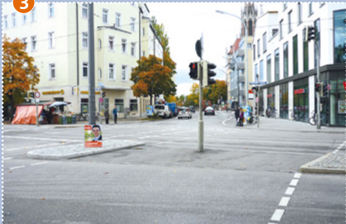
Kreuzung Tegernseer Landstraße/Ichostraße