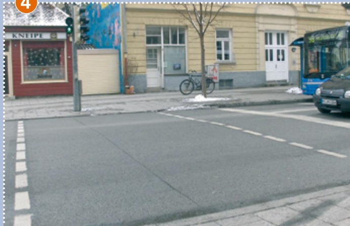
Fußgängerampel zwischen Schulhofeingang und Bushaltestelle an der Silberhornstraße (Bitte hierzu auch die Hinweise rechts neben dem Plan beachten)