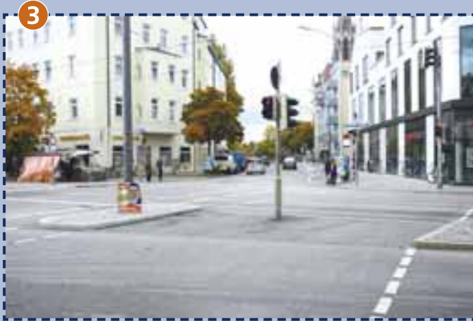
3 Kreuzung Tegernseer Landstraße/Ichostraße