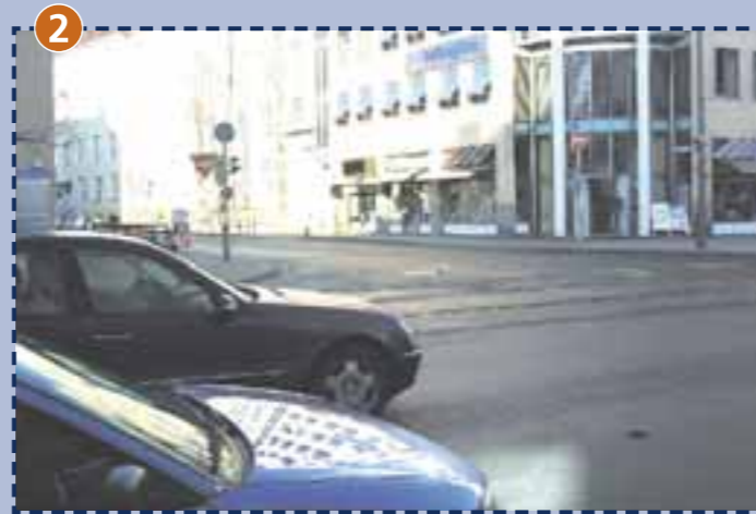
2 Kreuzung Tegernseer Landstraße/Silberhornstraße