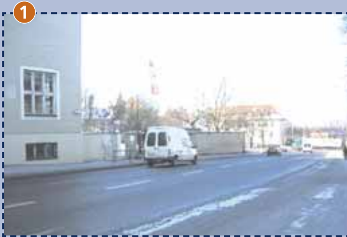
1 Grundschule an der Ichostraße (Eingang)