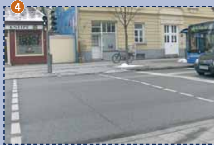
4 Fußgängerampel zwischen Schulhofeingang und Bushaltestelle an der Silberhornstraße (Bitte hierzu auch die Hinweise rechts neben dem Plan beachten)