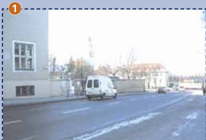
Grundschule an der Ichostraße (Eingang)