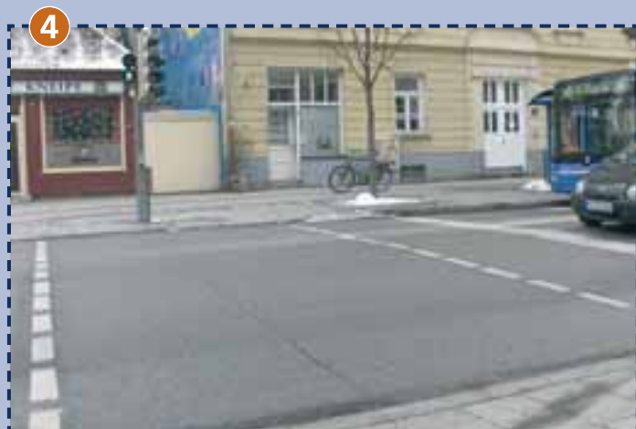
Fußgängerampel zwischen Schulhofeingang und Bushaltestelle an der Silberhornstraße (Bitte hierzu auch die Hinweise rechts neben dem Plan beachten)