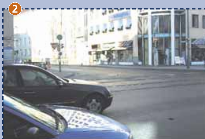
Kreuzung Tegernseer Landstraße/Silberhornstraße